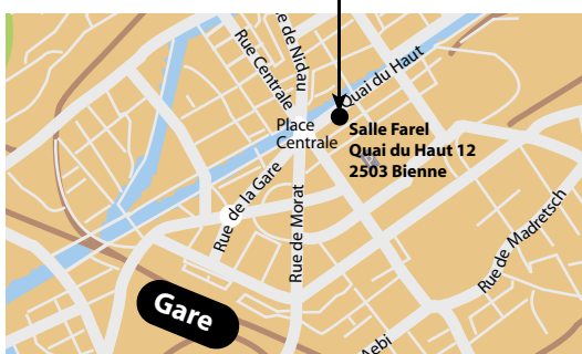
A la Salle Farel, Quai du Haut 12, 2503 Bienne

en Suisse aussi, les inégalités sociales. Alors que les managers des grandes multinationales s'attribuent des salaires-record, la pauvreté n'est plus un phénomène marginal et touche de plus en plus les salariés, en particulier les femmes, les jeunes et les immigrés. À cette naissance d'une «génération précaires», l'Etat répond par un durcissement des politiques sociales: réduction des prestations, mise au travail forcée et criminalisation de la précarité qui renforcent le sentiment d'insécurité sociale, faisant ainsi le jeu de la peur, du racisme et des «solutions autoritaires». La lutte contre le chômage, l'insécurité et la précarité est un combat décisif de nos jours. La troisième Université d'été d'attac suisse ne propose donc pas seulement de mieux comprendre ces politiques et leurs effets, mais surtout de discuter des possibles alternatives et moyens de résistance, à travers différents ateliers et sessions de formation, notamment: